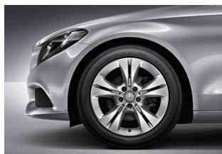
C 200 CGI Exclusive 225/50 R 17