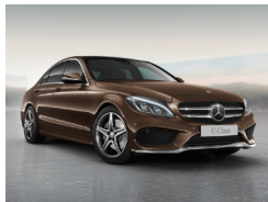
796 Marrón Citrina