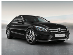
197 Negro Obsidiana