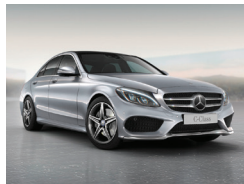
988 Plata Diamante