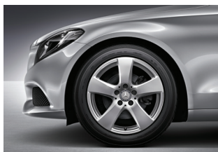
C 180 CGI 225/50 R 17

Las llantas son un elemento técnico imprescindible en cualquier vehículo, pero tienen también su importancia a nivel emocional: pocos detalles son tan relevantes como elegir los rines perfectos para su vehículo soñado. De ahí que hayamos preparado un elenco variado y atractivo para usted.