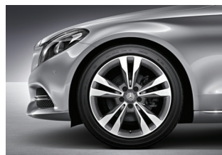
C 200 CGI Sport 225/45 R 18 delante 45/40 R 18 detrás