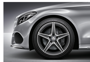
C 250 CGI Sport 225/45 R 18 delante 245/40 R 18 detrás