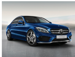
896 Azul Brillante