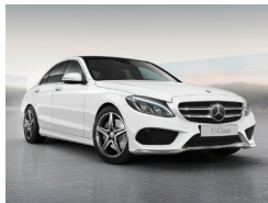
149 Blanco Polar